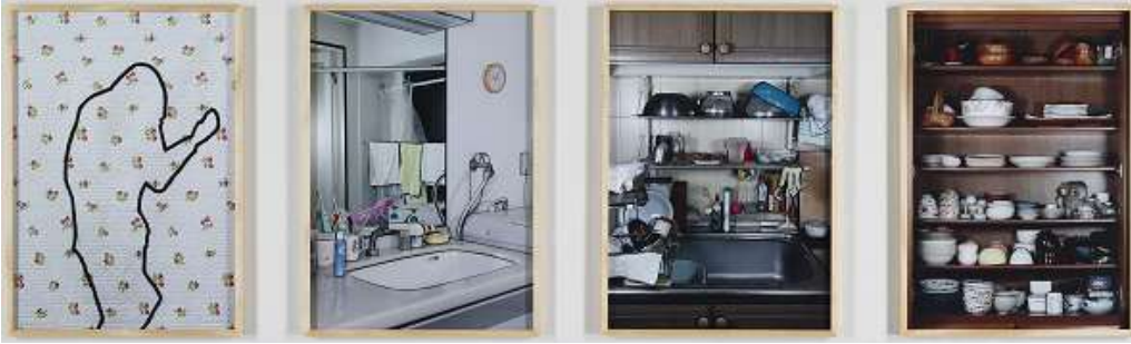
石場 文子 《2と3、もしくはそれ以外(祖母の家)》 インクジェットプリント、額 [107cm×76.8cmが4枚]