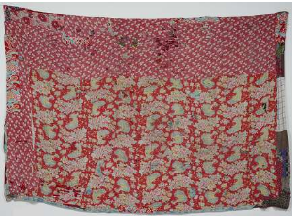
遠藤 薫 《ウエス》 雑巾 [240cm×390cm]