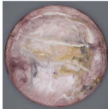
目 (荒神明香・南川憲二・増井宏文) 《アクリルガス》 樹脂・アクリル他 [φ170cm]