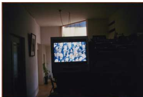
喜多村 みか 《TOPOS》 インクジェットプリント [120cm×180cmが2枚]